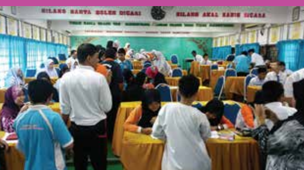
Jelajah Kemahiran INPENS di Sekolah Menengah Pengkalan Permatang (Pendidikan Khas) pada 16 April 2015.