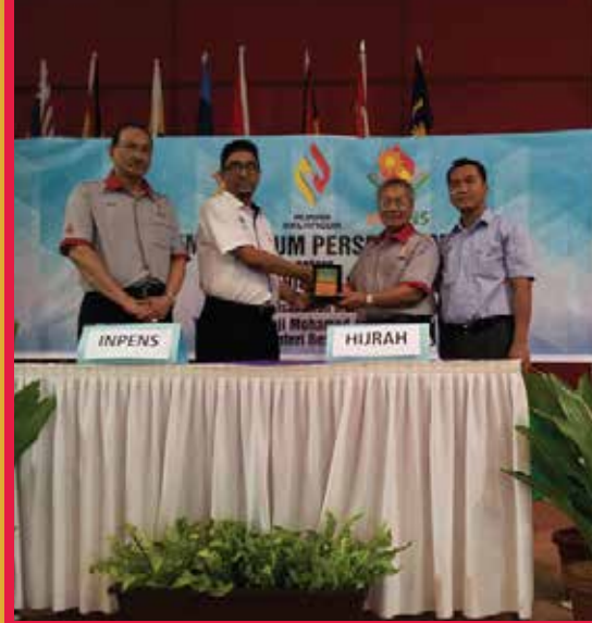
Majlis menandatangani MoU bersama HAJRAH SELANGOR untuk program keusahawanan.