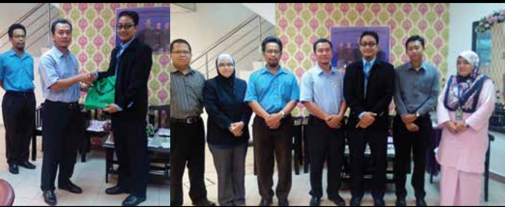
Kerjasama INPENS dan Mais Zakat Sdn. Bhd. (MSZB) bagi program kerjaya anak-anak asnaf zakat di INPENS.