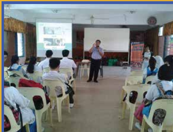
Jelajah Kemahiran INPENS di Sekolah Menengah Kebangsaan Ideal Height, Batu Caves pada 1 Julai 2015.