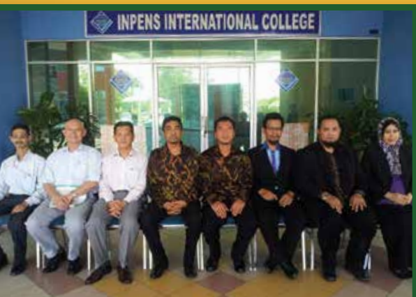
Lawatan Menteri Besar Selangor (Pemerbadanan) (MBI) ke INPENS.