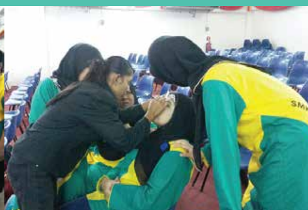
Program Jalinan Kasih bersama Bahagian Pendidikan Khas Sekolah Menengah Puncak Alam pada 20 Mei 2015.